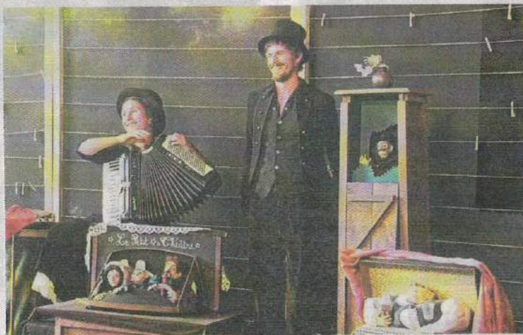
Le spectacle « Contes de fortune et d'infortune » en préparation, sera présenté dans un théâtre mobile en cours de fabrication.

notamment, leur expliquer et présenter leur travail. Les enfants, auront d'ailleurs la primeur du spectacle le 12 mars 2022.