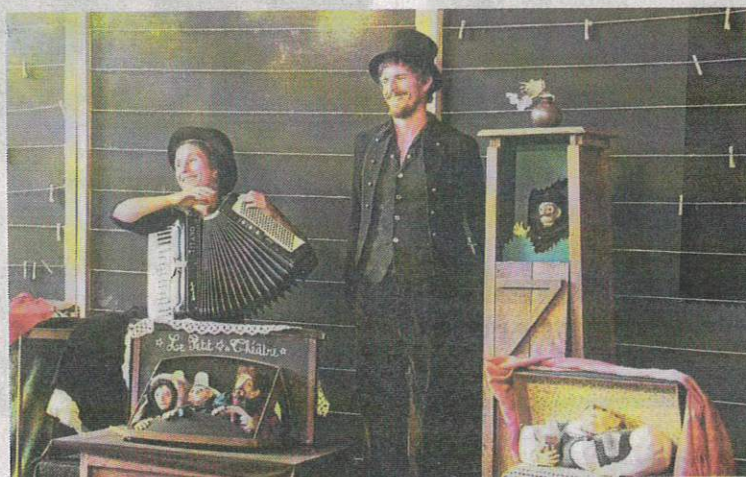
Le spectacle « Contes de fortune et d'infortune » en préparation, sera présenté dans un théâtre mobile en cours de fabrication.

notamment, leur expliquer et présenter leur travail. Les enfants, auront d'ailleurs la primeur du spectacle le 12 mars 2022.