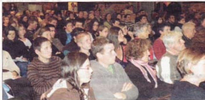
Les élèves en classe préparatoire aux concours sociaux du lycée Notre-Dame de Gouarec ont échangé avec les comédiens à l'issue de la pièce

Jeudi, deux manifestations locales ont marqué la Journée internationale pour l'élimination de la violence à l'égard des femmes.