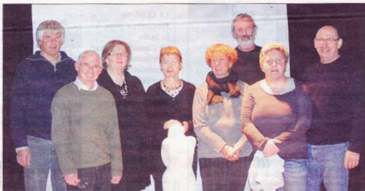
« Les poules qui lèvent la tête » : le nom de la troupe peut faire sourire. La pièce qu'elle jouera demain soir à Saint-Caradec, « J'ai jeté ma baleine à la mer », fera, quant à elle, réfléchir à coup sûr.

Dans le Centre-Bretagne, il est une petite troupe amateurs qui brûle les planches en s'engageant. Demain, elle luttera contre le tabou des violences conjugales.