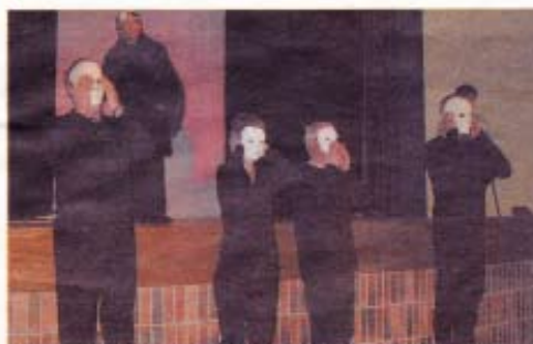
La troupe « des Poules qui lèvent la tête » a été ovationnée.

Comme 2010 est l'année de la cause des femmes violentées,